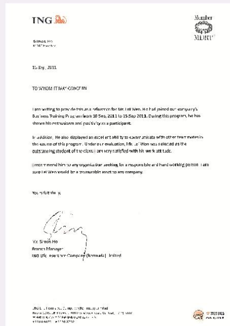
企业高层个人推荐信