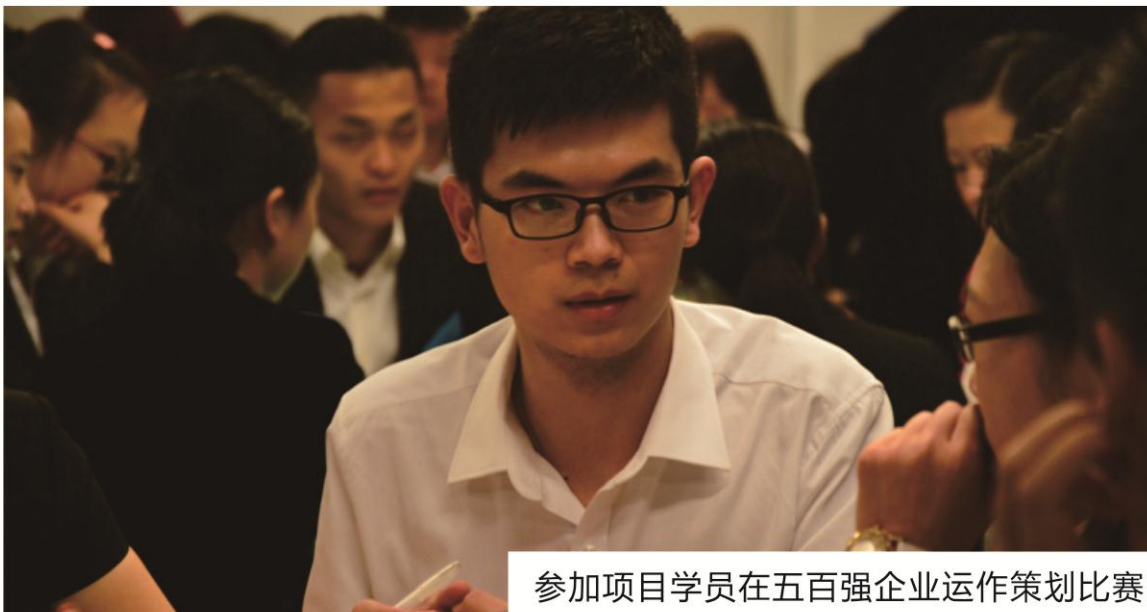
参加项目学员在五百强企业运作策划比赛

在一周内，每个团队在公司期间要参与以团队为单位的环球基金投资大赛。团队需要模拟管理个人、企业财富，在给定市场信息下以团队运作自己的基金。包括：环球经济数据发福，投资战略分析，决策制定，基金运作等环节。团队顾问和公司导师都会对参赛团队进行一定的指导。