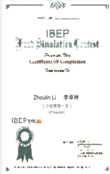
基金投资大赛证书