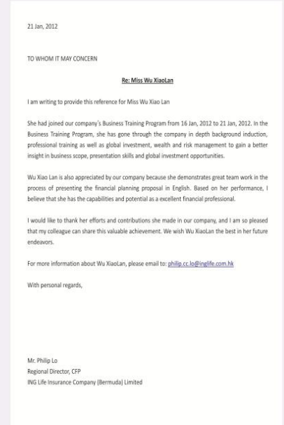
跨国企业公司推荐信