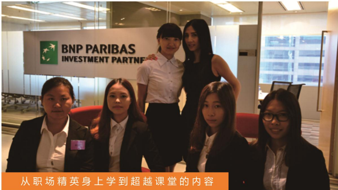
从职场精英身上学到超越课堂的内容