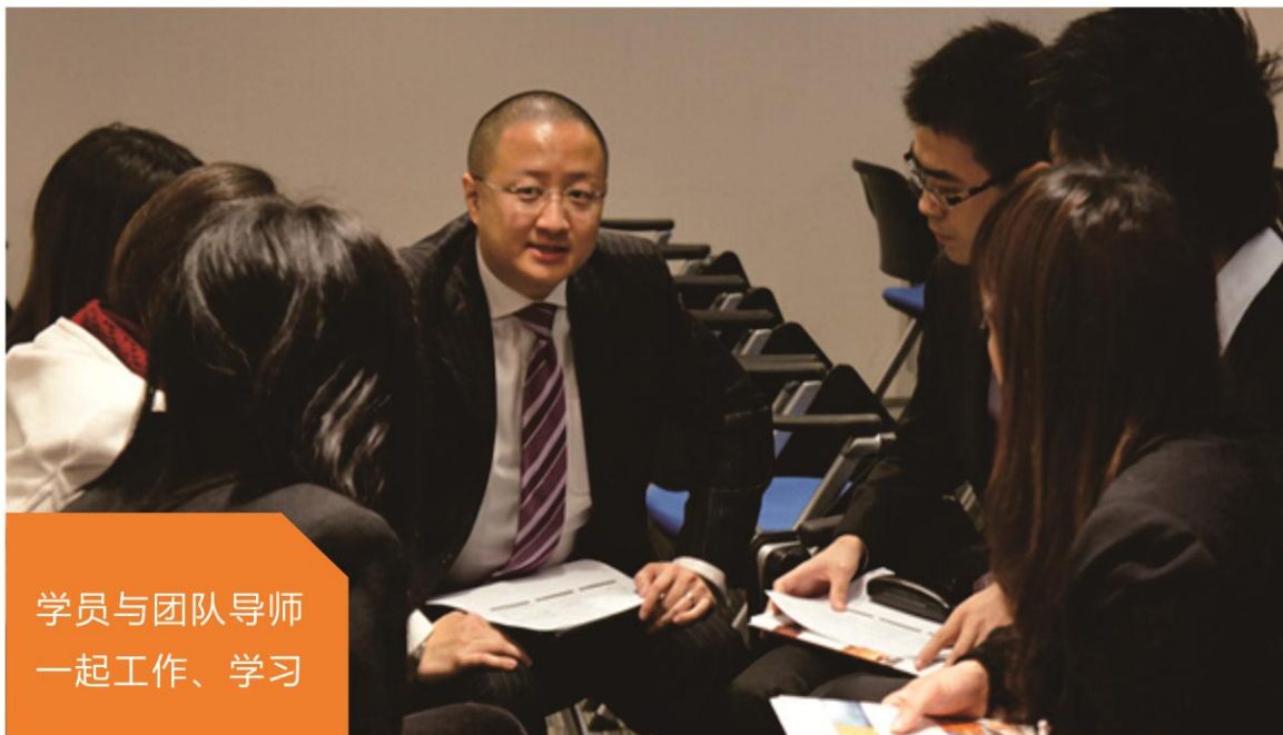
学员与团队导师 一起工作、学习